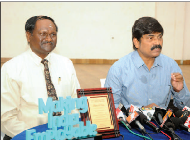
► మొదటి పేజీ తరువాయి

అవుతుందని వీసీ తెలిపారు. పాఠశాల స్థాయి విద్యార్థుల నుంచి పరిశోధకుల వరకు దీనిని వినియోగించుకునే అవకాశం కల్పిస్తున్నట్లు తెలిపారు. ఇప్పటికే ఏయూ ఇంజనీరింగ్ విద్యార్థులకు ఇండస్ట్రీ 4.0ని ఒక సజ్జెక్టుగా బోధించడం జరుగుతోందన్నారు. దీనిని గుర్తించి భారత భారీ పరిశ్రమల శాఖ ముందుకు వచ్చి నూతన ల్యాబ్ను ఏర్పాటు చేస్తోందన్నారు.