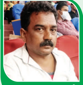
మూర్తి, విద్యార్థిని తండ్రి

నా కూతురు నా చిరకాల వాంఛ నెరవేర్చింది. ఆంధ్ర విశ్వవిద్యాలయంలో సిఎస్ఈ గ్రూప్ లో నా కూతురిని చేర్పించాను. మేము ఒడిస్సా రాష్ట్రంలో జీవన ఉపాధిని కొనసాగిస్తున్నాము. నా కూతురుకి భువనేశ్వర్ లో ఇంజనీరింగ్ కళాశాలలో సీటు వచ్చింది, తర్వాత ఆంధ్ర విశ్వవిద్యాలయం ఇంజనీరింగ్ కళాశాలలో సీటు రావడం జరిగింది. దీంతో అక్కడ సీటు విరమించుకుని ఇక్కడ చేరడం జరిగింది. ఇక్కడ చేరడంతో నా కూతురు నా కోరిక నెరవేరుస్తుందని, జీవితంలో ఉన్నతంగా ఎదుగుతుందని భావిస్తున్నాను.